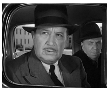
1950 DU SANG SUR LE TAPIS VERT (Backfire) de Vincent Sherman