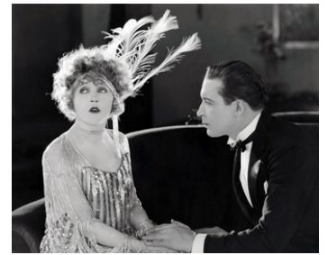
1922 LA ROSE DE BROADWAY (Broadway Rose) de Robert Z. Leonard avec Mae Murray