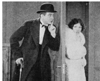
1925 MA FEMME ET SON FLIRT (Kiss me Again) d'Ernst Lubitsch avec Marie Prevost