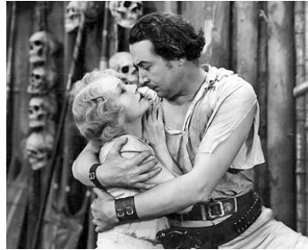
1930 ISLE OF ESCAPE d'Howard Bretherton avec Betty Compson