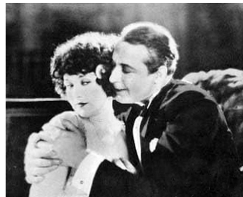
1924 FILLES DE PLAISIR (Daughters of Pleasure) de William Beaudine avec Marie Prevost