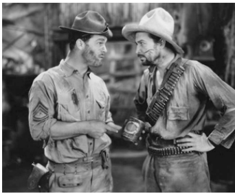
1929 OMBRES BLANCHES (White Shadows in the South Seas) de W. S. Van Dyke avec R. Anderson