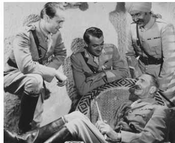
1935 LES 3 LANCIERS DU BENGAL d'Henry Hathaway avec F. Tone, G. Cooper, C. A. Smith