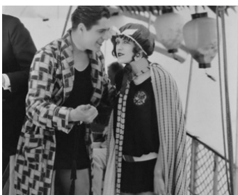
1926 OTHER WOMEN'S HUSBANDS d'Erle C. Kenton avec Marie Prevost