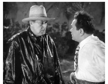
1948 KEY LARGO (Key Largo) de John Huston avec Edward G. Robinson