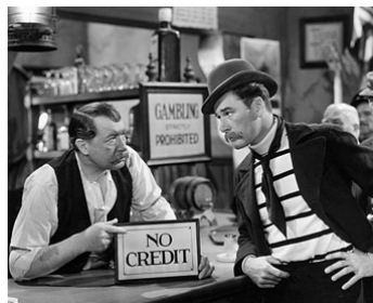
1943 REMERCEZ VOTRE BONNE ÉTOILE de David Butler avec Errol Flynn