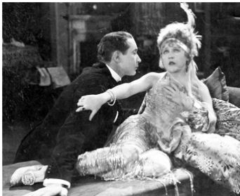
1922 AU PAON (Peacock Alley) de Robert Z. Leonard avec Mae Murray