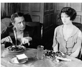
1927 POMMES AMÈRES (Bitter Apples) d'Harry O. Hoyt avec Myrna Loy