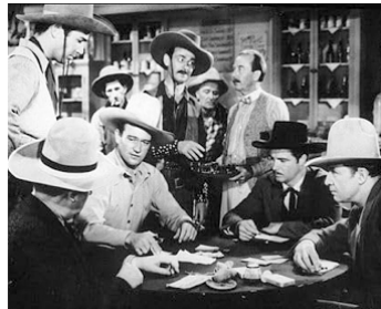
1937 LA VILLE DU DIABLE (Born to the West) de Ch. Barton avec John Wayne, J. Patterson