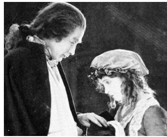
1921 LES DEUX ORPHELINES (Orphans of the Storm) de David W. Griffith avec Lillian Gish