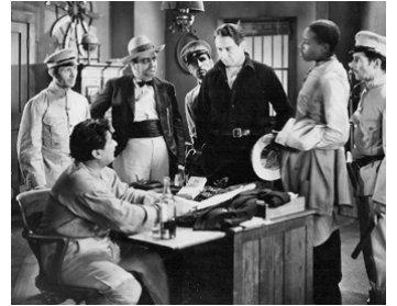
1932 LE SECRET DU CHAUFFEUR (The Stoker) de Chester M. Franklin avec Noah Beery Sr