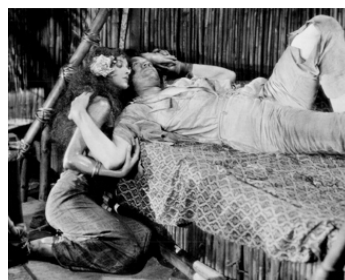
1926 MARQUITA L'ESPIONNE (Across the Pacific) de Roy Del Ruth avec Myrna Loy