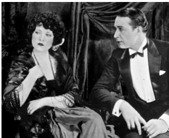
1924 HOW TO EDUCATE A WIFE de Monta Bell avec Marie Prevost