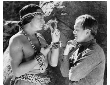
1938 LES VAUTOURS DE LA JUNGLE (Hawk of the Wilderness) de J. English avec Dick Wessel