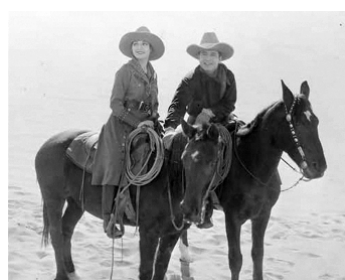
1927 LA BRUTE (The Brute) d'Irving Cumming avec Leila Hyams