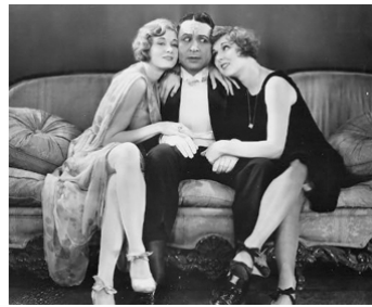
1929 SANS DÉFENSE (No Defense) de Lloyd Bacon avec Kathryn Carver, May McAvoy