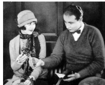
1925 RED HOT TIRES d'Erle C. Kenton avec Patsy Ruth Miller