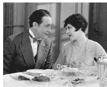
1926 LES SURPRISES DE LA T.S.F. (So this is Paris) d'Ernst Lubitsch avec Patsy Ruth Miller