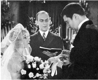
1929 L'HOMME AUX 2 VISAGES (Skin Deep) de Ray Enright avec B. Compson, G. E. Stone