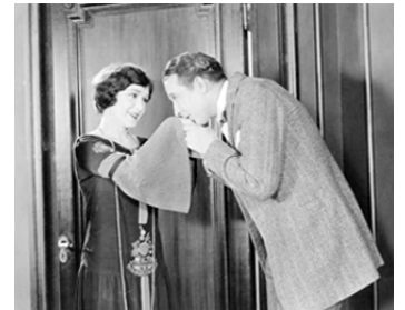
1924 COMÉDIENNES (The Marriage Circle) d'Ernst Lubitsch avec Florence Vidor