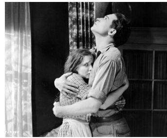
1921 LE CŒUR NOUS TROMPE (The Affairs of Anatol) de Cecil B. DeMille avec Agnes Ayres