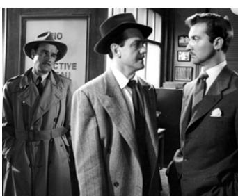
1949 LA GARCE (Flaxy Martin) de Richard L. Bare avec Douglas Fowley, Zachary Scott