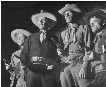
1934 LA DERNIÈRE RONDE (The Last Round up) d'H. Hathaway avec F. Knight, Randolph Scott