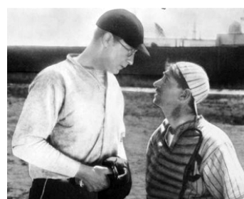
1927 THE BUSH LEAGUER d'Howard Bretherton avec Clyde Cook