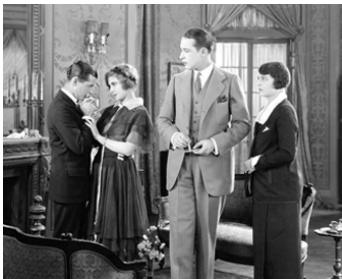
1925 LE CYGNE NOIR (The Dark Swan) de Millard Webb avec H. Chadwick, J. Patrick, L. Tashman