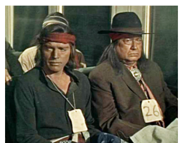
1954 BRONCO APACHE (Apache) de Robert Aldrich avec Burt Lancaster