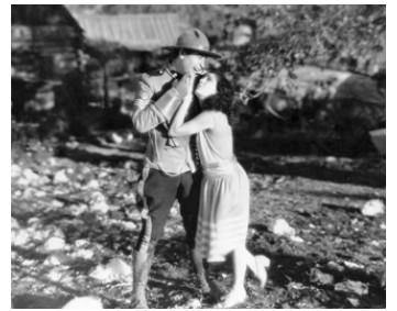
1929 LA TIGRESSE (Tiger Rose) de George Fitzmaurice avec Lupe Velez