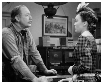
1947 CHEYENNE (The Wyoming Kid) de Raoul Walsh avec Jane Wyman