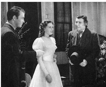
1940 LES EXPLOITS DE BILL HICKOK (Young Bill Hickok) de J. Kane avec R. Rogers, Julie Bishop